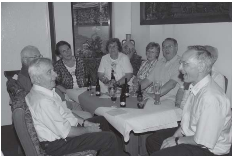
Singe, wem Gesang gegeben.....