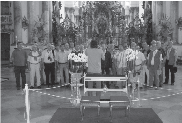
Im Münster Zwiefalten

Der Polizeichor Tübingen, 1999 zu Gast in Fulda, hatte uns zur Mitwirkung an seinem Frühlingskonzert in die Hermann Hepper Halle in Tübingen am 21. Mai eingeladen. Gerne nahmen wir die Einladung an und unternahmen mit Ehefrauen und Begleitpersonen eine dreitägige Konzertreise. Kurz vor der Ankunft in Tübingen wurde unser Reisebus von einem Kradfahrer der Polizeidirektion Tübingen „abgefangen“ und zur Dienststelle eskortiert. Hier erwarteten uns bereits Vorstandsmitglieder und Sänger des PC Tübingen und begrüßten uns herzlich. Am Nachmittag konnten wir Tübingen besichtigen und bei einem gemeinsamen Abendessen mit unseren Tübinger Freunden die ersten Lieder erklingen lassen. Am nächsten Vormittag stand eine Albrundfahrt auf dem Programm. Das Münster Zwiefalten, einer der größten Kirchenräume Deutschlands, war unser Ziel. Hier wurde das prachtvolle barocke Münster „Unserer lieben Frau“ als ehemalige Klosterkirche der Benediktinerabtei Zwiefalten besichtigt. Die beeindruckende Architektur und Kirchenbaukunst machte ergriffen.